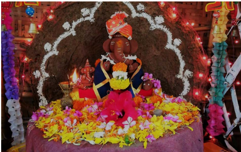
Symbiosis International | Pune, India

Die Summer School hat mir einen neue Seite von Indien gezeigt, die ich vorher nicht erwartet hätte. Vor allem durch den Austausch mit den indischen Studenten war es möglich das Land und seine Menschen besser kennenzulernen. Auch die Möglichkeit das Ganesha-Festival hautnah miterleben zu können wird mir in Erinnerung bleiben.